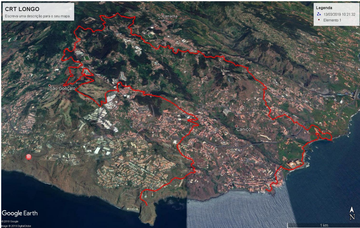
Fig. 2 - CRT Longo