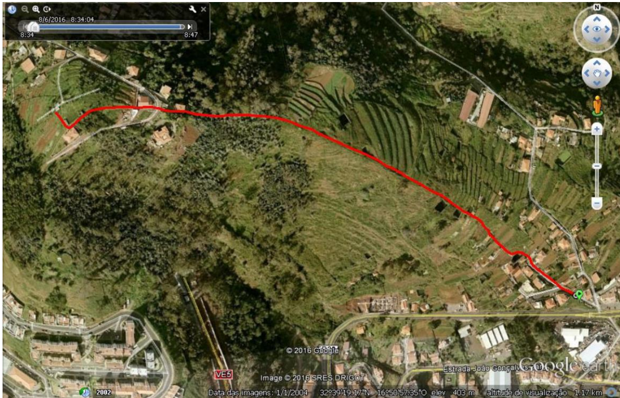
Fig. 4 - Desafio ” Mountain Challenge ” - Monte da Azenha