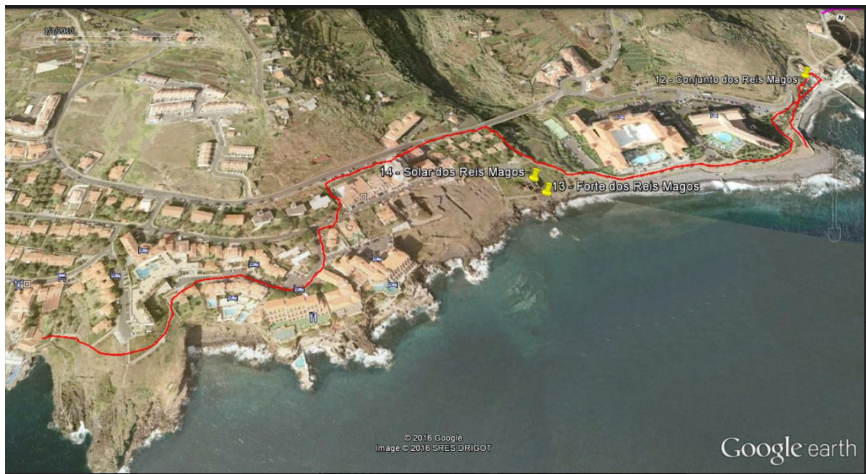
Fig. 3 - CRT Jovem